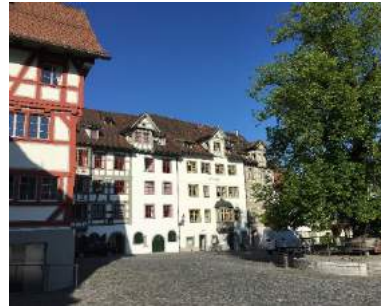
Gallusstrasse 32 CH-9000 St. Gallen