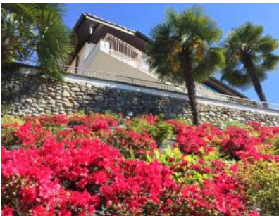
Via Cosliva 28 CH- 6926 Montagnola/Lugano