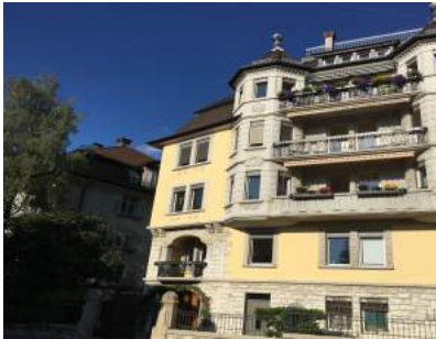
Turnerstrasse 6 CH-8006 Zürich