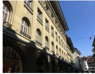
Neuengasse 20 CH-3011 Bern