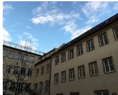
Theresienstrasse 18 DE-80333 München