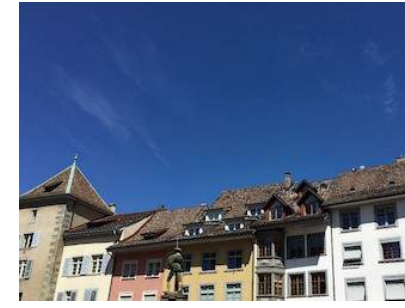
Fronwagplatz 8 CH-8200 Schaffhausen