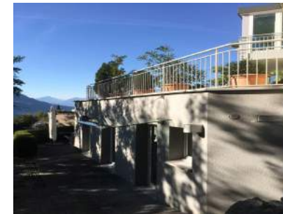
Gutacker 12 FL-9488 Schellenberg

Für weitere Informationen kontaktieren Sie bitte: info@ernstchristian.ch T +41 71 230 22 23 (Hauptnummer)